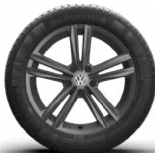
Sebring in grijs metallic