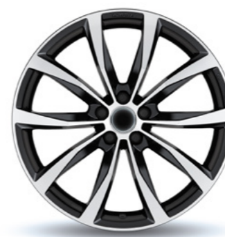
Stijl 12 zwart gepolijst