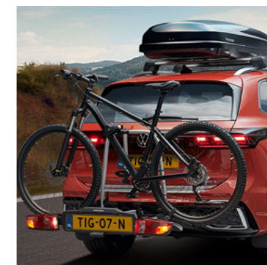
Fietsendrager, dakdrager en -koffer