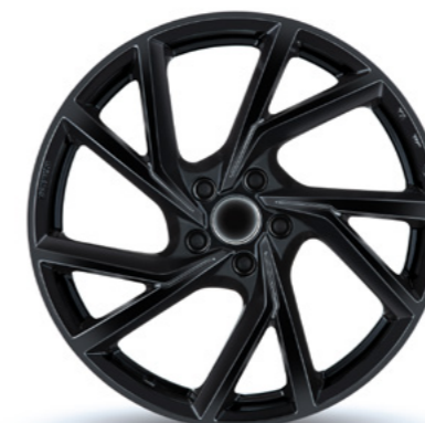
Stijl 2 hoogglans zwart