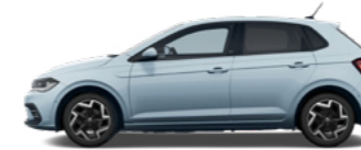
Crystal Ice Blue