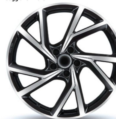
Stijl 2 zwart gepolijst