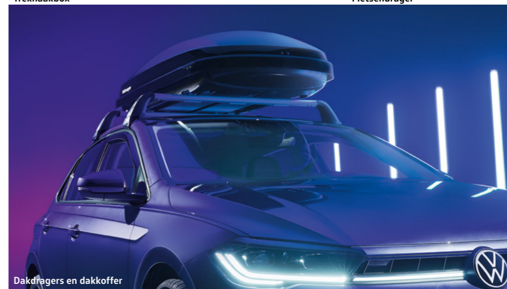
Dakdragers en dakkoffer