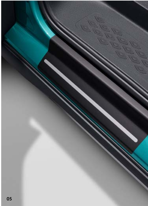
05 Volkswagen instapfolie zwart/zilver** € 181 - Bescherming voor instapdorpels - set 4 stuks Art.nr. 1T3071310 ZMD

Kijk voor de actuele prijzen en acties op shop.volkswagen.nl