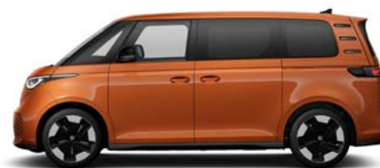
Energetic Orange metallic lak