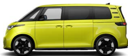
Lemon Yellow metallic lak