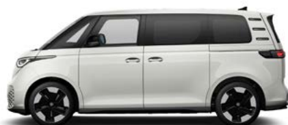
Candy White unilak