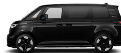
Deep Black Pareffect metallic lak