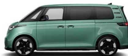
Bay Leaf Green metallic lak