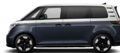
Two-tone Candy White / Starlight Blue metallic lak