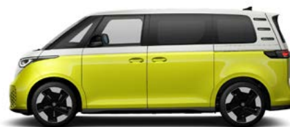
Two-tone Candy White / Lemon Yellow metallic lak