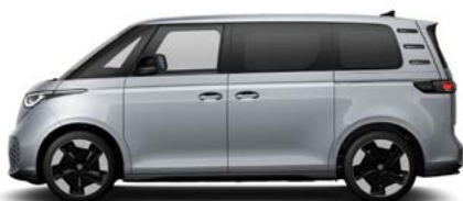
Mono Silver metallic lak