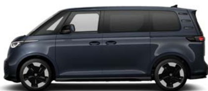
Starlight Blue metallic lak