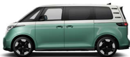
Two-tone Candy White / Bay Leaf Green metallic metallic lak