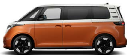
Two-tone Candy White / Energetic Orange metallic lak